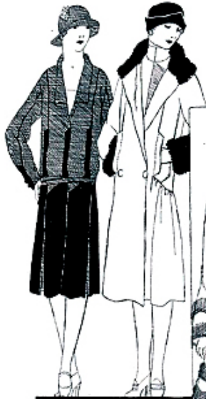
1. Nende 2. Bernard & C o