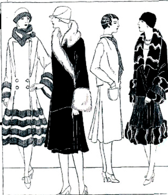
3. Anna (Madeleine et Madeleine) 4. Lelong 5. Martial & Armand 6. Lefc